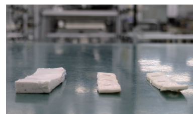
左:新規熱伝導パッド 右:経年劣化したもの

製品内部にはIC等の部品から熱を逃がす熱誘導パッドを使用していますが、使用状況や経年により劣化していきます。柔らかい素材の熱誘導パッドは長年使用すると薄く硬質化していき、効果が下がってきます。このような状態になるまえに、一度分解クリーニングにて交換することをおすすめしています。