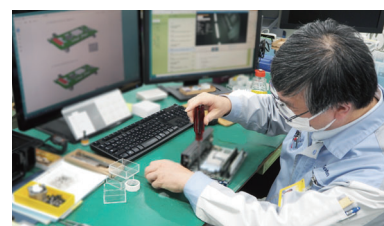
分解作業:熱誘導パッドの劣化確認